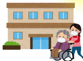
高齢者施設など に行くとき