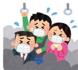
混雑した乗り物の中