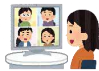
双方向の オンライン学習